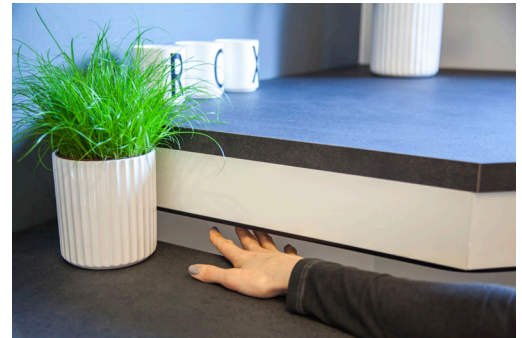
ROPOX KLEMLISTE TIL BORDPLADER

Når der er aktiveret sikkerhedsstop i systemet, vil den Smartbox, som sikkerhedsstoppet er tilsluttet, begynde at blinke. Det er derfor meget nemt at finde det aktiverede sikkerhedsstop, så man kan løse problemet.