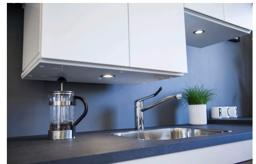
ROPOX SIKKERHEDSPLADE TIL OVERSKABE

SIKKERHEDSPLADE ER INSTALLERET FOR AT UNDGÅ KLEMRISIKO NÅR SYSTEMET KØRER NED