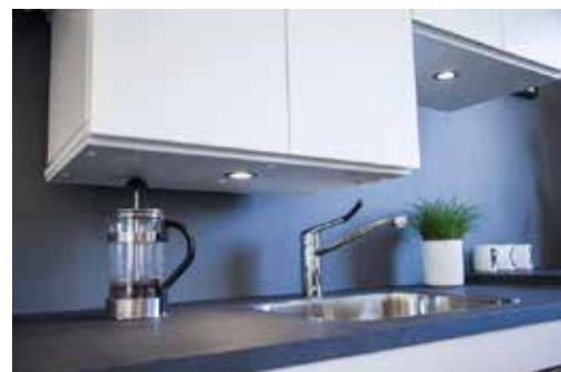
ROPOX SIKKERHEDSPLADE TIL OVERSKABE

SIKKERHEDSPLADE ER INSTALLERET FOR AT UNDGÅ KLEMRISIKO NÅR SYSTEMET KØRER NED