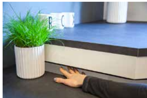
ROPOX KLEMLISTE TIL BORDPLADER

Når der er aktiveret sikkerhedsstop i systemet, vil den Smartbox, som sikkerhedsstoppet er tilsluttet, begynde at blinke. Det er derfor meget nemt at finde det aktiverede sikkerhedsstop, så man kan løse problemet.