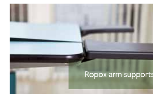
Ropox arm supports

Ropox' Vision-bordserie rummer et bredt udvalg af borde med mange individuelle justeringsmuligheder samt tilbehør.