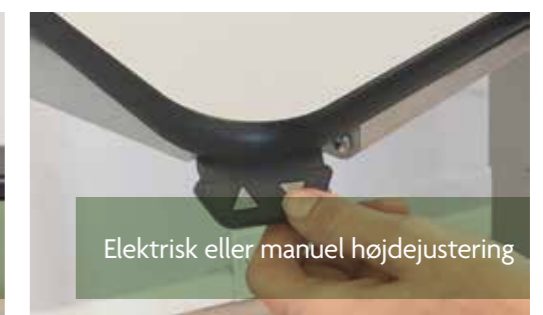
Elektrisk eller manuel højdejustering