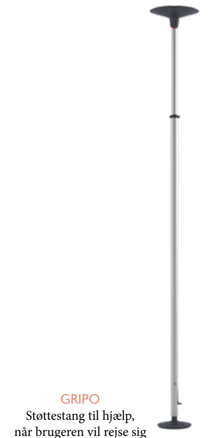
GRIP0 Støttestang til hjælp, når brugeren vil rejse sig