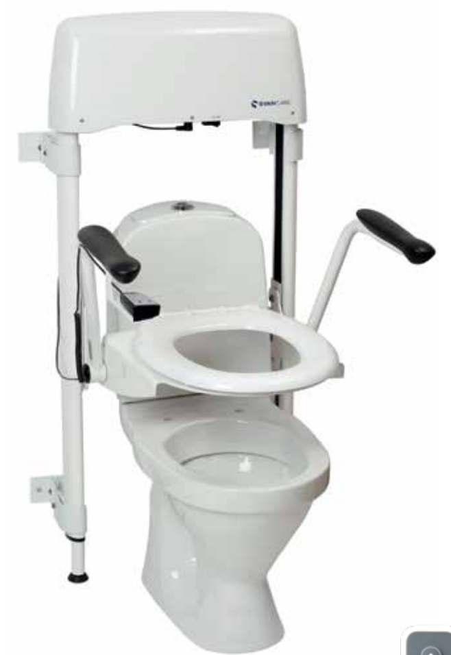
Svan Lift væghængt model Varenr.: 35-02001 / HMI no.: 109398

Gulvmodel der placeres direkte på badeværelsesgulvet. Svan Lift fastgøres med beslag på toiletet.