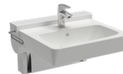
ROPOX QUICK HÅNDVASK Vasken skydes ud fra væggen og sænkes 14 cm