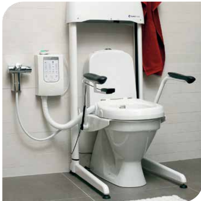
SVAN BIDETTE R3 KOMBINERET MED SVAN LIFT.

Alle Svan Cares produkter er udviklet, så de skal kunne tilpasses og kombineres, og brugeren får præcis det hjælpemiddel, der er behov for.