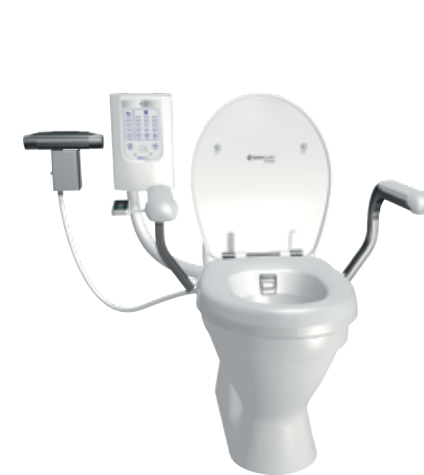
SVAN BIDETTE R3 Bidetmodul til toiletet med vaske- og tørrefunktion

Se mere af vores sortiment på www.ropox.dk