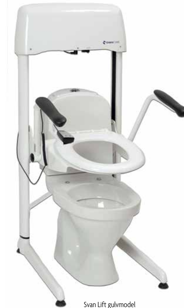
Svan Lift gulvmodel Varenr.: 35-02000 / HMI no.: 72669

Gulvmodel der placeres direkte på badeværelsesgulvet. Svan Lift fastgøres med beslag på toiletet.