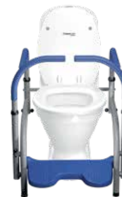
BALANCE Flexibelt system til toiletet, som giver ekstra støtte til børn og voksne