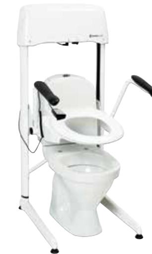
SVAN LIFT Toiletsædeløfter